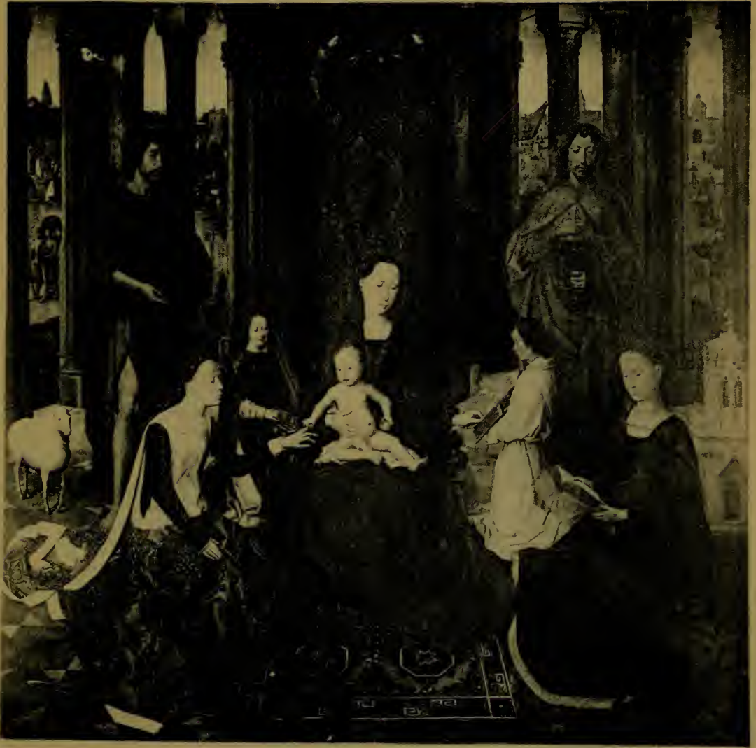
Le Mariage Mystique de Ste-Catherine. Panneau central du triptyque.